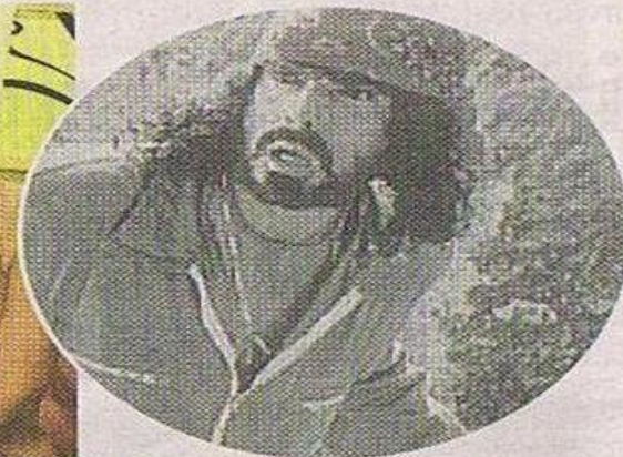
Protagonista Tomas Milian sul set con Eva Henger

Ritorno Tomas Milian racconta il suo rapporto speciale con la città